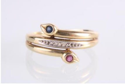
Gold 585, tlw. rhodiniert, Saphir, Rubin, RW 61, 3,8 gøg4