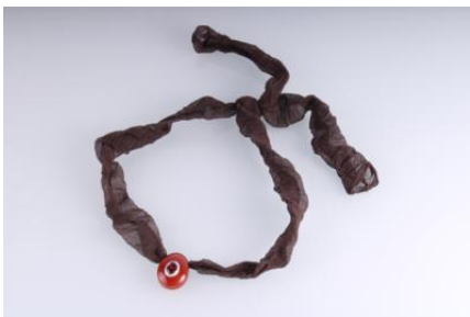
Gold 585, tlw. rhodiniert, Granat, Schmuckstein, auf Stoffband, 12,1 gøg1