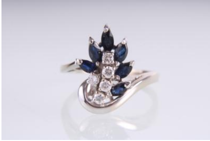
Weißgold 585, Sapphire, RW 55, 3,8 gøg4