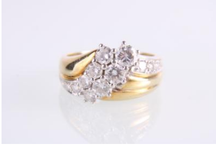
Gold 585, tlw. rhodiniert, RW 52, 4,7 gøg5