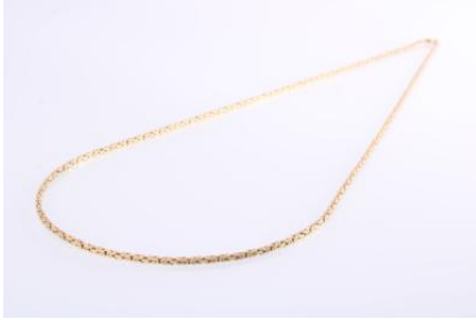
Gold 585, Länge ca. 60 cm, 14,4 gøg14