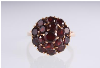
Gold 585, RW 59, 5,4 gøg5