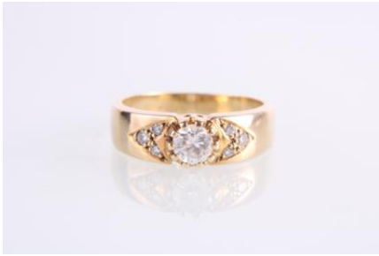
Gold 585, RW 53, 4,5 gøg4