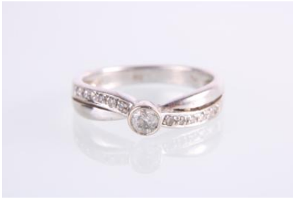
Weißgold 585, RW 54, 4 gøg4