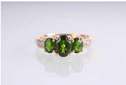
Gold 585, tlw. rhodiniert, Turmaline, RW 57, 2,9 gøg3