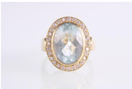
Gold 585, Aquamarin ca. 5 ct, RW 53, 7,4 gøg7