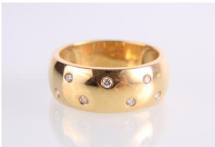
Gold 585, RW 57, 5,2 gøg5