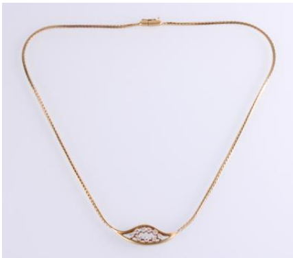
Gold 585, Länge ca. 41 cm, Steckschließe, Sicherheitsverschluss, 13,7 gøg14