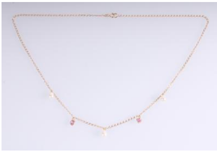
gold 585, drei Kulturperlen, zwei rosa Imitationssteine, Länge ca. 43 cm, 2,3 gøg2