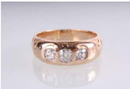
Gold ca. 580, österreichische Amtspunze von 1872-1922, Ziergravur, Altschliffdiamanten zus. ca. 0,55 ct, RW 58, 7,3 gØG7 Diamant tlw. ausgeschartet, altersübliche Tragespuren