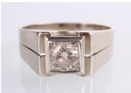
Weißgold 585, RW 66, 6,9 gøg7