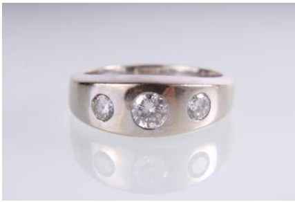
Weißgold 585, RW 59, 7,6 gØG8