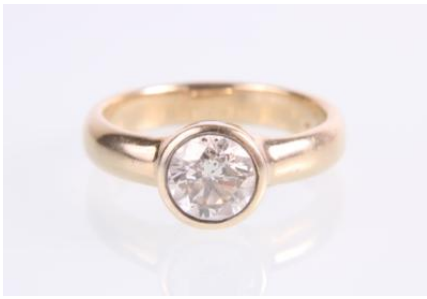
Gold 585, RW 57, 6,1 gøg6