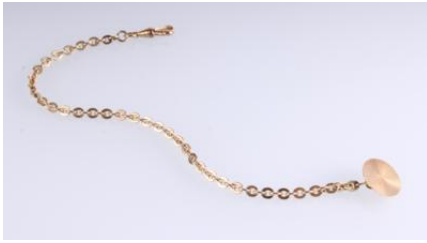
Gold 585, Länge ca. 23 cm, 11,1 gøg11