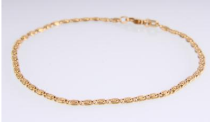
Gold 585, Länge ca. 19 cm, 3,1 gøg3