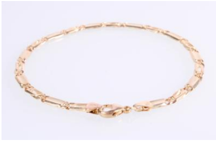
Gold 5853, Länge ca. 22 cm, 9,4 gøg9