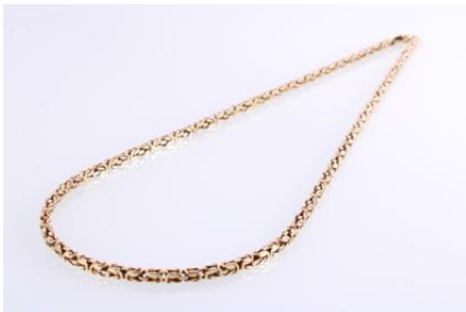
Gold 585, Länge ca. 59 cm, 51,8 gøg52