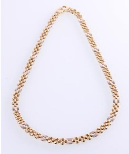
Gold Weißgold 585, Länge ca. 43 cm, 25 gøg25