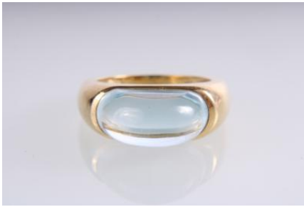
Gold 750, RW 53, 9,3 gØG8 Topas mit Oberflächenmerkmalen