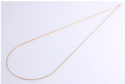
Gold 585, Länge ca. 55 cm, 5,2 gøg5