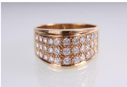
Gold 585, RW 57, 6,1 gØG6