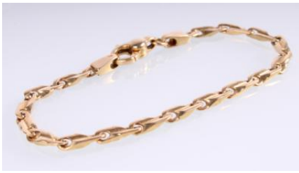
Gold 585, Länge ca. 17 cm, 9,2 gøg9