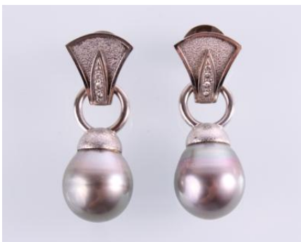
Weißgold 750, Brillanten, je 1 Tahiti-Kulturperle ca. DM 15 mm, 24,2 gøg17