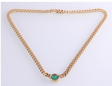
Gold 585, massiv, Länge ca. 44 cm, Steckschließe, Sicherheitsverschluss, 58,5 gøg58