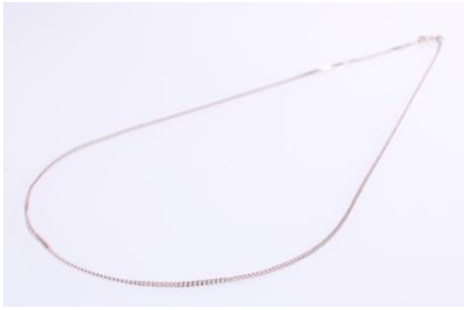
Weißgold 585, Länge ca. 41 cm, 2,8 gøg3