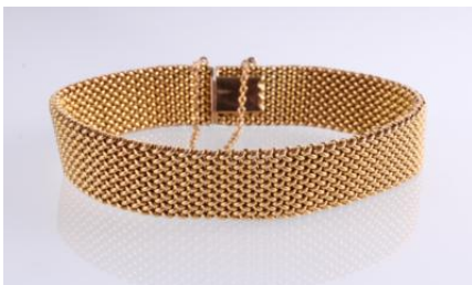
Gold 580, österr. Amtspunze von 1872-1922, Steckschließe mit Sicherheitskette, Länge ca. 19 cm, 32,5 gøg33