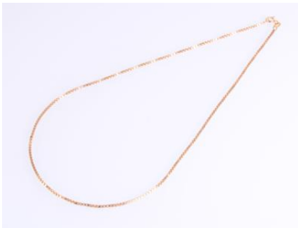
Gold 585, Länge ca. 43 cm, 6,4 gøg6