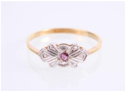
Gold 585, tlw. rhodiniert, RW 53, 1,3 gøg1