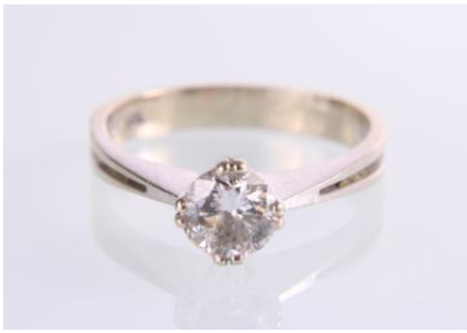
Weißgold 585, RW 55, 3 gøg3