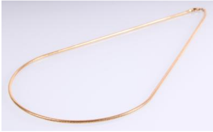
Gold 585, Länge ca. 44 cm, 5,2 gøg5