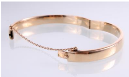
Gold ca. 580, österreichische Amtspunze von 1872-1922, Innenumfang ca. 51 x 61 mm, Breite ca. 7 mm, Steckschließe, Sicherheitskette, 11,9 gøG12 altersübliche Tragespuren