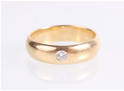
Gold 585, ein Brillant, RW 51,4,2 gøg4