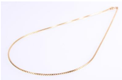
Gold 585, Länge ca. 40 cm, 5,4 gøg5