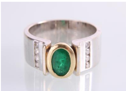
Gold/Weißgold 585, Smaragd ca. 0,5 ct, RW 55, 8,1 g, Smaragd lockerøg8