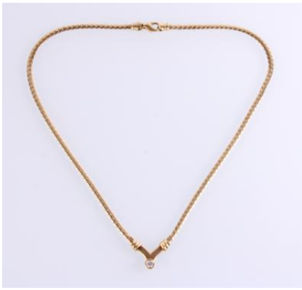
Gold 585, Länge ca. 44 cm, 20,1 gøg20