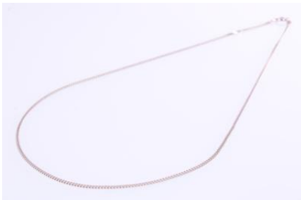
Weißgold 585, Länge ca. 41 cm, 2,8 gøg3