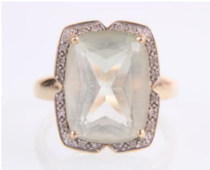
Gold 585, tlw. rhodiniert, ein grüner Beryll, RW 53, 6,5 gøg4