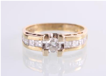
Gold/Weißgold 750, mittlerer Brillant ca. 0,30 ct, RW 54, 3,7 gøg4