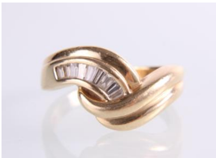
Gold 585, RW 52, 4,1 g, Lötstelleøg4