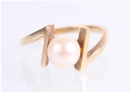
Gold 585, RW 54,5, 3,3 gøg3