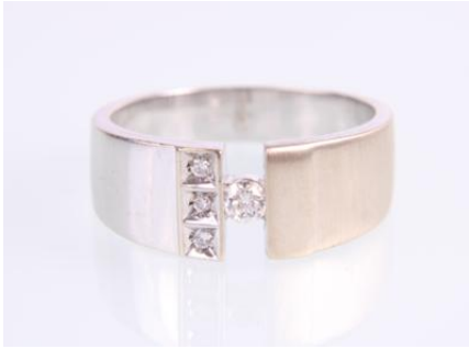
Weißgold 585, tlw. mattiert, RW 56, 6,4 gøg6