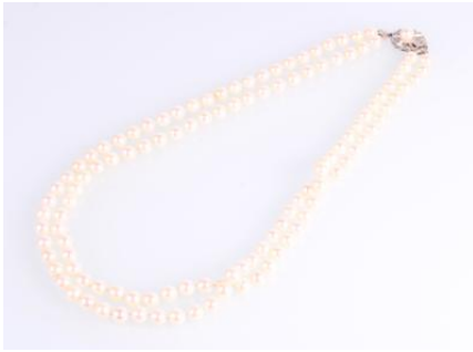
Weißgoldschließe 750, tlw. durchbrochen gearbeitet, Perldurchmesser ca. 6,5-6,7 mm, Länge ca. 50 cm, Steckschließe, Sicherheitsachter, 57,2 gøg2