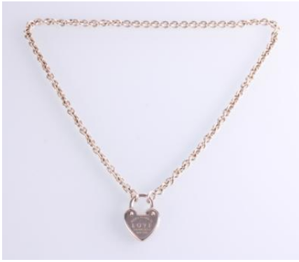
Silber 925, Länge ca. 45 cm, 38,3 gøg38