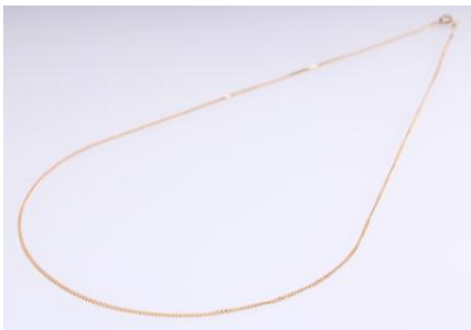
Gold 585, Länge ca. 46 cm, 1,6 gøg2