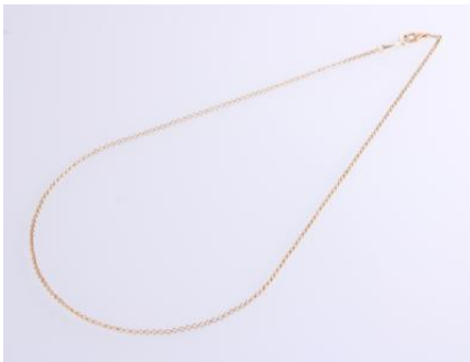
Gold 585, Länge ca. 42 cm, 3,1 gøg3