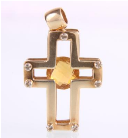
Gold 585, tlw. rhodiniert, 4,6 gøg4