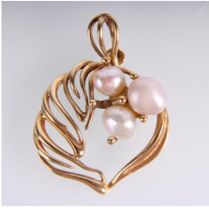
Gold 585, 2,3 gøg2