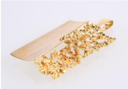
Gold 585, tlw. durchbrochen gearbeitet, Maße 4 x 2,2 cm, 5 g øg5