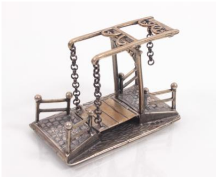
Silber 835, beweglich montiert, Länge ca. 5,8 cm, 40 gøS40