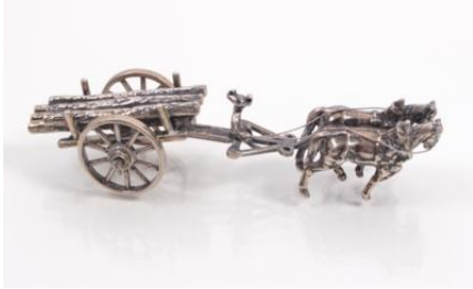
Silber 835, Länge ca. 10,5 cm, tlw. beweglich montiert, 74,7 gøS75