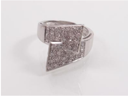
Weißgold 585, RW 52, 5,4 g, ØG5