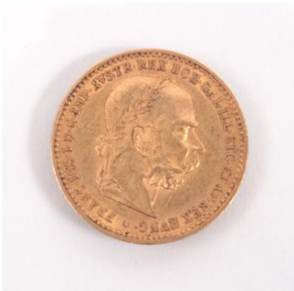
Gold 900, 3,38 g, Kratzer