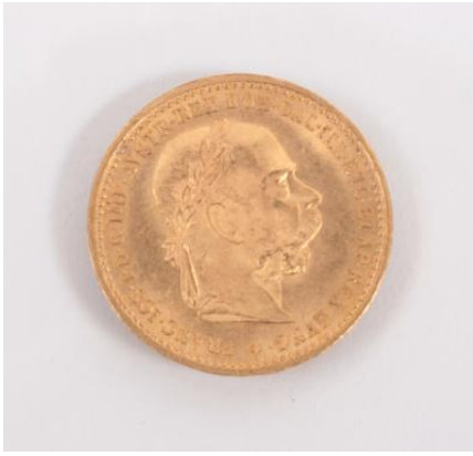
Gold 900, 3,38 g, Kratzer