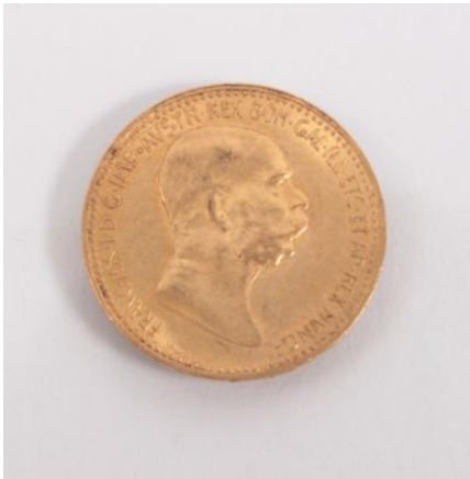
Gold 900, 3,38 g, Kratzer