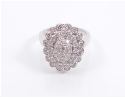
Weißgold 585, RW 56, 7,7 gØG7