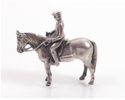
Silber 835, Höhe ca. 5,5 cm, 71,1 gøS71