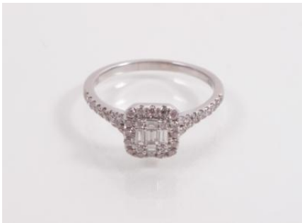
Weißgold 750, RW 58, 3,1 g, ØG3