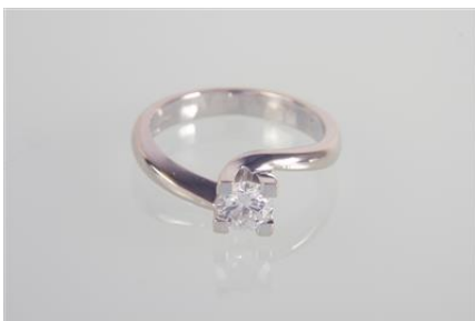
Weißgold 750, RW 49,4 gØG4