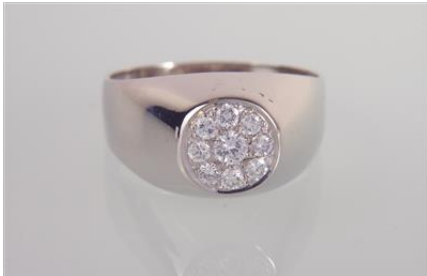
Weißgold 585, RW 62, 7,1 gØG7