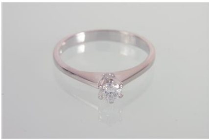
Weißgold 750 RW 54, 2,7 gØG3