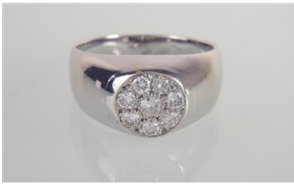
Weißgold 585, RW 62, 7,7 gØG8