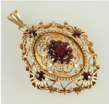
Gold 585, 12,3 gøg12