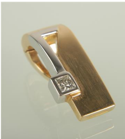
Gold 585, tlw rhodiniert, aufklappbares Collant, 3 gøg3