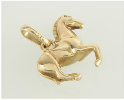
Gold 585, 7,5 gøG8